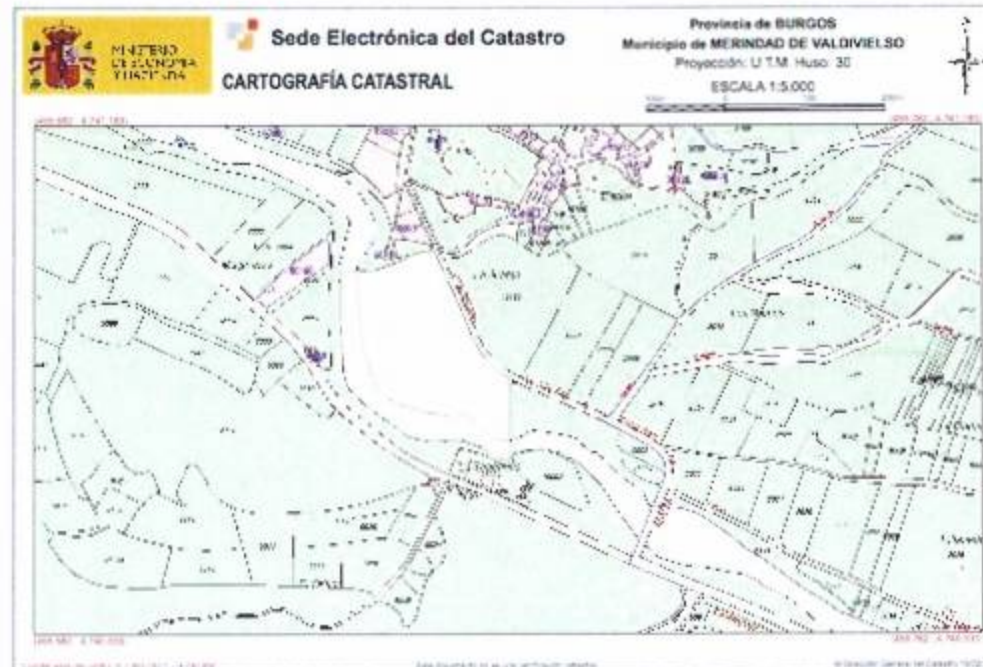
SITUACIÓN E 1/5.000